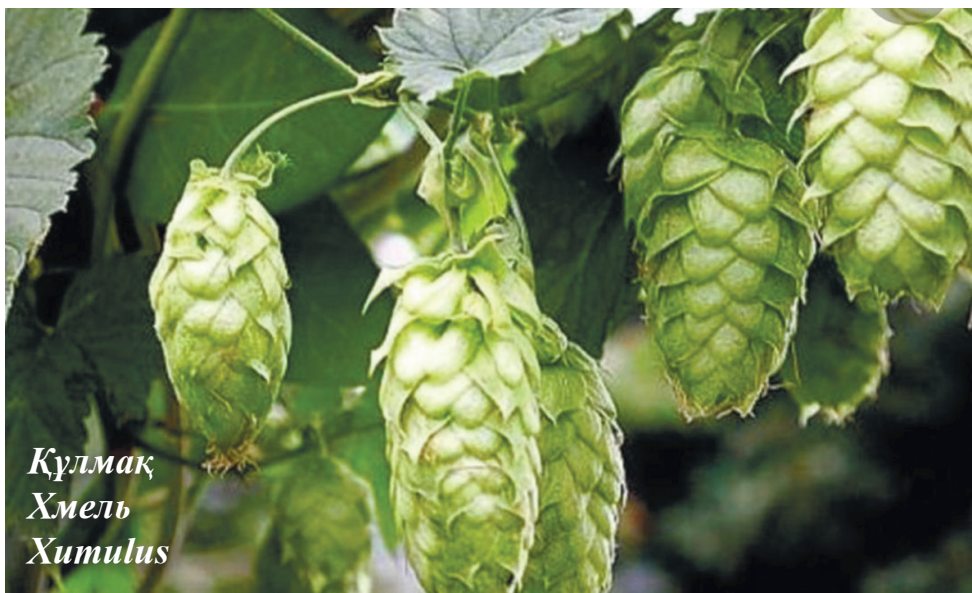
Құлмақ Хмель Humulus

Солтүстік жер шарында және Жаңа Зеландияда таралған 50 – ге жуық (кейбір деректерде 80) түрі, бұдан КСРО – да (негізінен Қиыр Шығыста өсетін) 17 түрі болған, оның ішінде Қазақстанда 2 түрі бар.