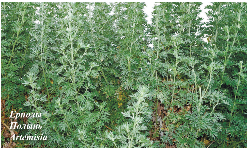
Ернолы Полынь Artemisia

Орманды жерлерде, өзен жағаларында, сайларда, бұталардың арасында өседі. Қазақстанның барлық жерінде кездеседі