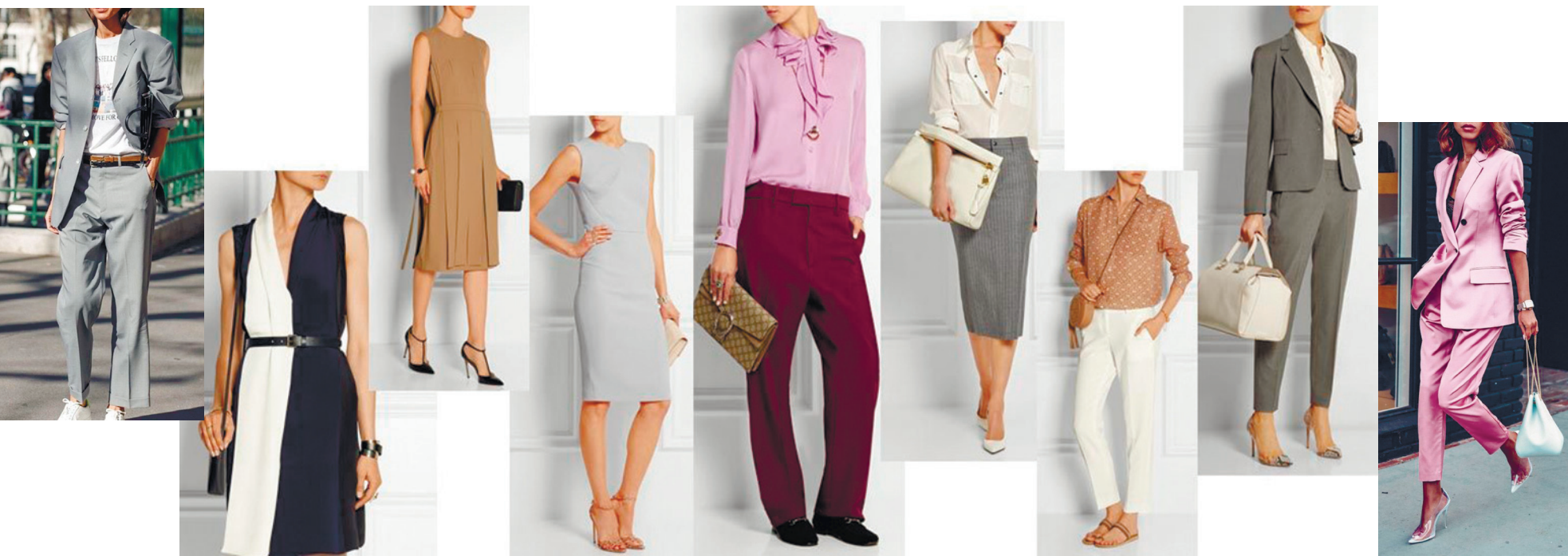
Офисный дресс-код на лето или просто «хорошие идеи»

4-5 стр. подготовлены Алтынай МАХИМОВОЙ.