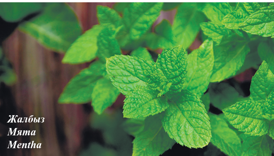
Жалбыз Мята Mentha

Жер бетінде Бақбақтың 700 жуық түрі бар, ал Қазақстанда бақбақтың 59 түрі бар, оның 23-і сирек кездесетін эндемик өсімдіктер болып саналады