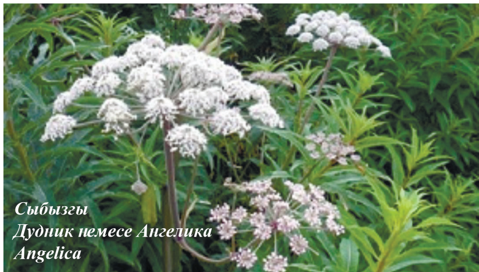
Сыбызғы Дудник немесе Ангелика Angelica

Қазақстанда жалбыз туысының 10 түрі өседі