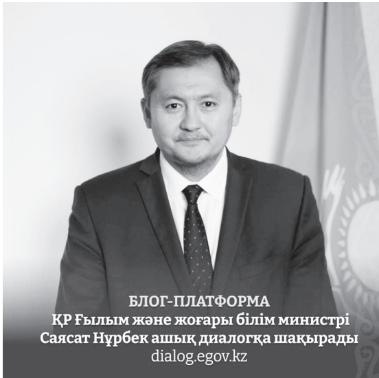
БЛОГ-ПЛАТФОРМА ҚР Ғылым және жоғары білім министрі Саясат Нұрбек ашық диалогқа шақырады dialog.egov.kz

Порталдың негізгі мақсаты – азаматтардың мемлекеттік органдардың жұмысына қатысты ойларын білу. Портал арқылы кез келген адам нақты бір мемлекеттік органға немесе жергілікті әкімшілікке тікелей өтініш білдіруге және ұсыныс жасауға, әлеуметтік маңызды сауалнамаларға қатысуға мүмкіндік алады.