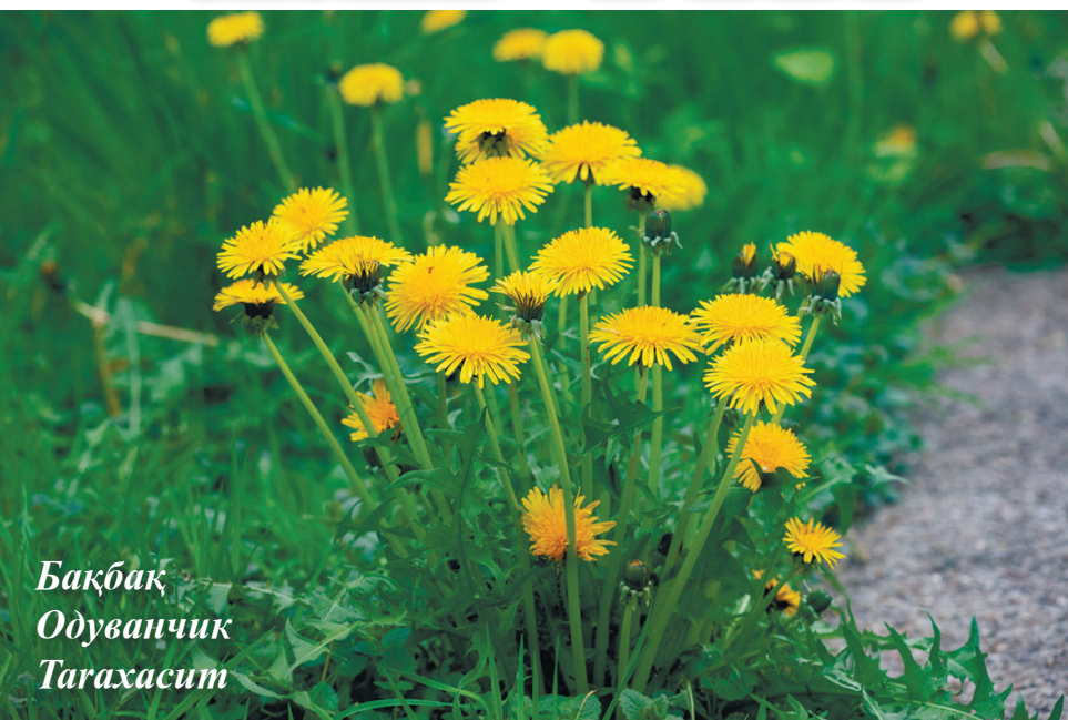
Бақбақ Одуванчик Taraxacum

Күрделі гүлділер тұқымдасына жататын көп жылдық, кейде бір не екі жылдық шөптесін өсімдіктер.