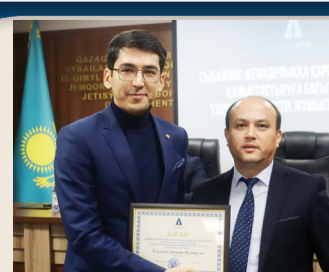
УВЕРЕННЫЙ ШАГ В СВЕТЛОЕ БУДУЩЕЕ