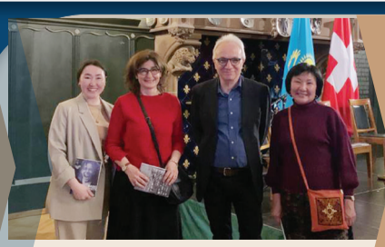
«ОРТАЛЫҚ АЗИЯ ҚҰҚЫҒЫ» ЖОБАСЫ – ХАЛЫҚАРАЛЫҚ ЫНТЫМАҚТАСТЫҚТЫҢ ЖАҢА СЕРПІНІ