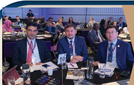
ДҮНИЕЖҮЗІЛІК БІЛІМ ФОРУМЫ БІЗГЕ НЕ БЕРЕДІ?