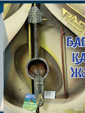
БАБАДАН ҚАЛҒАН ЖӘДІГЕР