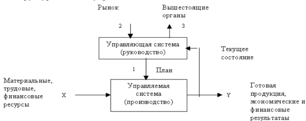
Рис. 1.2. Структура системы управления

Очевидно, что и планы, и содержание обратной связи - не что иное, как информация. Поэтому процессы формирования управляющих воздействий как раз и являются процессами преобразования экономической информации. Реализация этих процессов и составляет основное содержание управленческих служб, в том числе экономических. К экономической информации предъявляются следующие требования: точность, достоверность, оперативность.