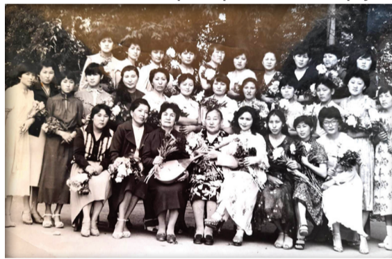
1983 жыл 20 мамыр. Алғашқы қазақ топтарының соңғы қоңырауы