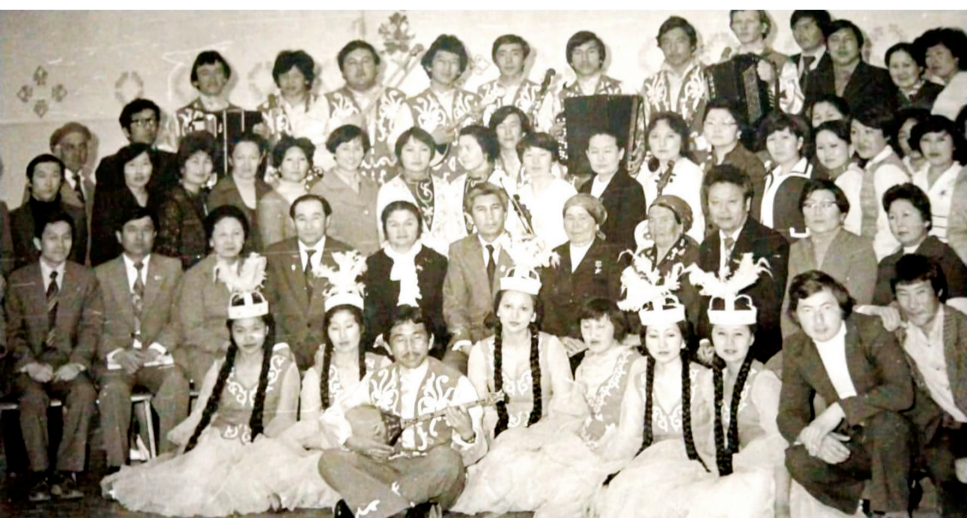
Музыка және мектепке дейінгі педагогика студенттерінің облыстың еңбек жеңімпаздарымен кездесу іс-шарасы, 1986 жыл

«Мектепке дейінгі және бастауыш білім беру» зертханасынан көрініс уақыт талабына сәйкес жұмыс берушілермен байланыста ұйымдастыру үшін «Мектепке дейінгі және бастауыш білім беру» зертханасы ашылды. Бұл шешім МДҰ тәрбиешілермен дуалды оқыту жүйесін енгізуде тиімді болды. Жұмыс беруші мекемелермен семинарлар өткізу мектепке дейінгі болашақ педагогтердің кәсіби біліктілігін арттыруда теориялық білімді іс-тәжірибемен сабақтастыруды жүзеге асырады. І. Жансүгіров атындағы Жетісу университеті 2022 жылы «Атамекен» ҚР Ұлттық кәсіпкерлер палатасы, ҚР Білім және ғылым министрлігімен бірлесіп өткізген жоғары оқу орындарының білім беру бағдарламаларының рейтингісіне қатысып, оң нәтиже көрсетті. Білім беру бағдарламалары рейтингісінің нәтижелері бойынша 1 орынға – Мектепке дейінгі оқыту және тәрбиелеу ББ ие болды. І.Жансүгіров атындағы Жетісу университетінің оқу-тәрбие жұмыстарын жүргізу үшін барлық мүмкіндіктер жасалған. Сандық технологиялармен жабдықталған аудиторияларда теориялық білімдерін практикамен ұштастырып, студенттерге толыққанды білім алуға мүмкіндік береді. Педагогика және психология жоғары мектебінің деканы PhD философия докторы Ерлан Хаймұлдауовтың басқаруымен оқыту процесінде оқытушы-профессорларының жоспарын жүзеге асыруға әлеуеті жеткілікті.