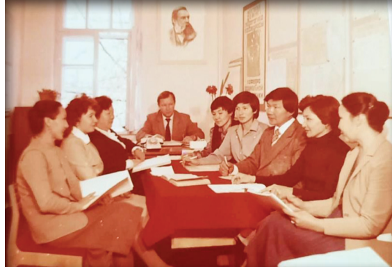
Мектепке дейінгі педагогика кафедрасының ұжымы. 1989 жыл

орысша тәрбиеленетін мектеп жасына дейінгілерге қазақ тілін оқыту, мейрамдар ұйымдастыру сияқты пәндер әрі теориялық, әрі практикалық тұрғыда жүргізілді. Бұл бағытта Москва қаласындағы КСРО-ның ғылым академиясына қарасты мектепке дейінгі ғылыми-зерттеу институтының ғалымдарымен (директоры И.И.Подъяков), лаборатория зерттеушілерімен (меңгерушісі Ф.А.Сохин) факультеттің ғылыми ізденушілері байланыс орната білді. А. Арысбаева мектепке дейінгі педагогика оқулығының авторы В.И.Ядешконың жетекшілігімен Ленин атындағы МГПУ-де тағылымдама өтіп, зерттеу жұмыстарын бастайды. Мектепке дейінгі мекемелерге педагог әрі психолог мамандарын ғылыми негізде даярлайтын факультеттің шебер мектебін құрғызу мақсатында кафедралардың ассистенттері сол кездердегі Москва, Томск қалаларының осы саладағы білім беру және зерттеу орталықтары ғалымдарымен (А.Г.Арушанова,