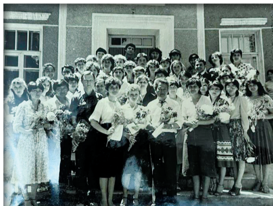
1982 жыл. Алғашқы түлектердің соңғы қоңырауы

1994 жылы «Қазақ балабақша бағдарламасы» проблемасы бойынша уақытша ғылыми-зерттеу комитеті (ВНИК) құрылды. Факультеттің профессор-оқытушылар құрамы ғылыми тұрғыда беки түсуіне бір ықпал өткен жайт Москва,