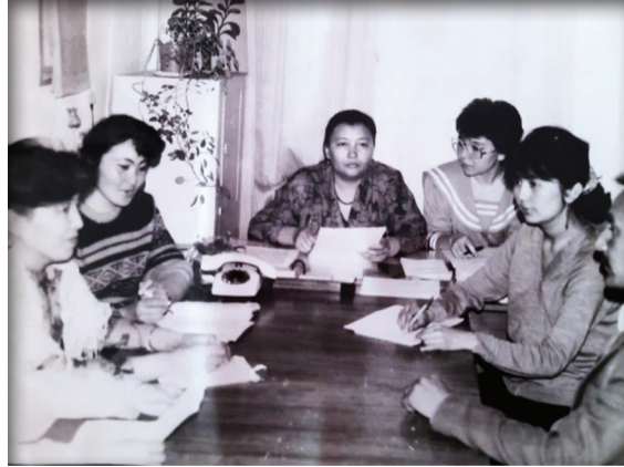
«Мектепке дейінгі тәрбие методикасы» кафедрасы ұжымы. 1985 жыл