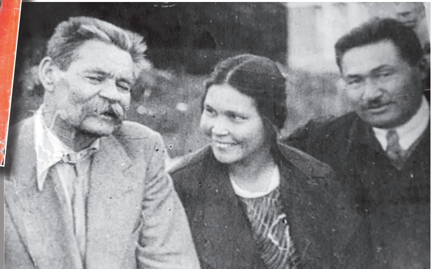
Суретте: солдан оңға қарай Максим Горький, Фатима Ғабитова, Илияс Жансүгіров