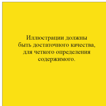
Рисунок 1 – Название рисунка

Иллюстрации должны быть достаточного качества (минимум 300dpi), для четкого определения содержимого. Иллюстрации должны быть пронумерованы. Все иллюстрации и названия иллюстрации должны быть выровнены по центру, названия должны быть расположены по центру под иллюстрацией. Иллюстрации и названия иллюстраций должны быть разделены пробелами от остального текста.