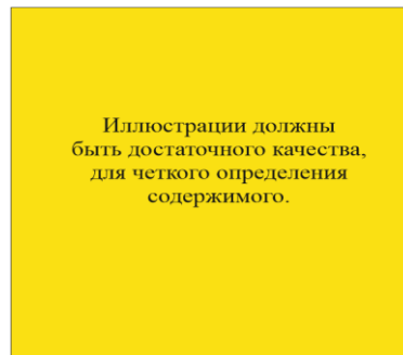
Рисунок 1 – Название рисунка

Иллюстрации должны быть хорошего качества (минимум 300dpi) и пронумерованы сквозной нумерацией. Все иллюстрации с их подписями должны быть выровнены по центру, подписи располагаться непосредственно под иллюстрацией и отделяться пробелами от остального текста. Шрифт – Times New Roman, кегль – 12 пт.